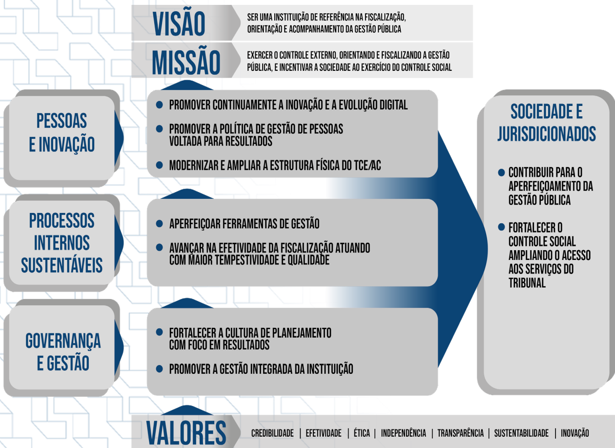
Figura 1: Mapa Estratégico do TCE/AC 2023-2026.

O Mapa Estratégico reúne, de forma visual e sintética, a estratégia da organização, apresentando a sua missão, visão, valores, perspectivas e os objetivos estratégicos.